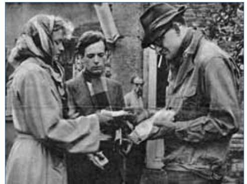
Schwarzmarkt in der Nachkriegszeit