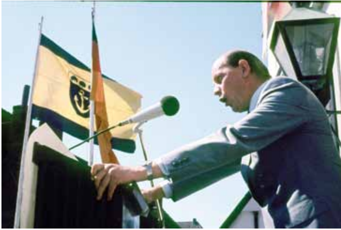
Minister Burkhard Ritz auf der Rathauptreppe unter der Fahne des Landkreises Lingen, 1975