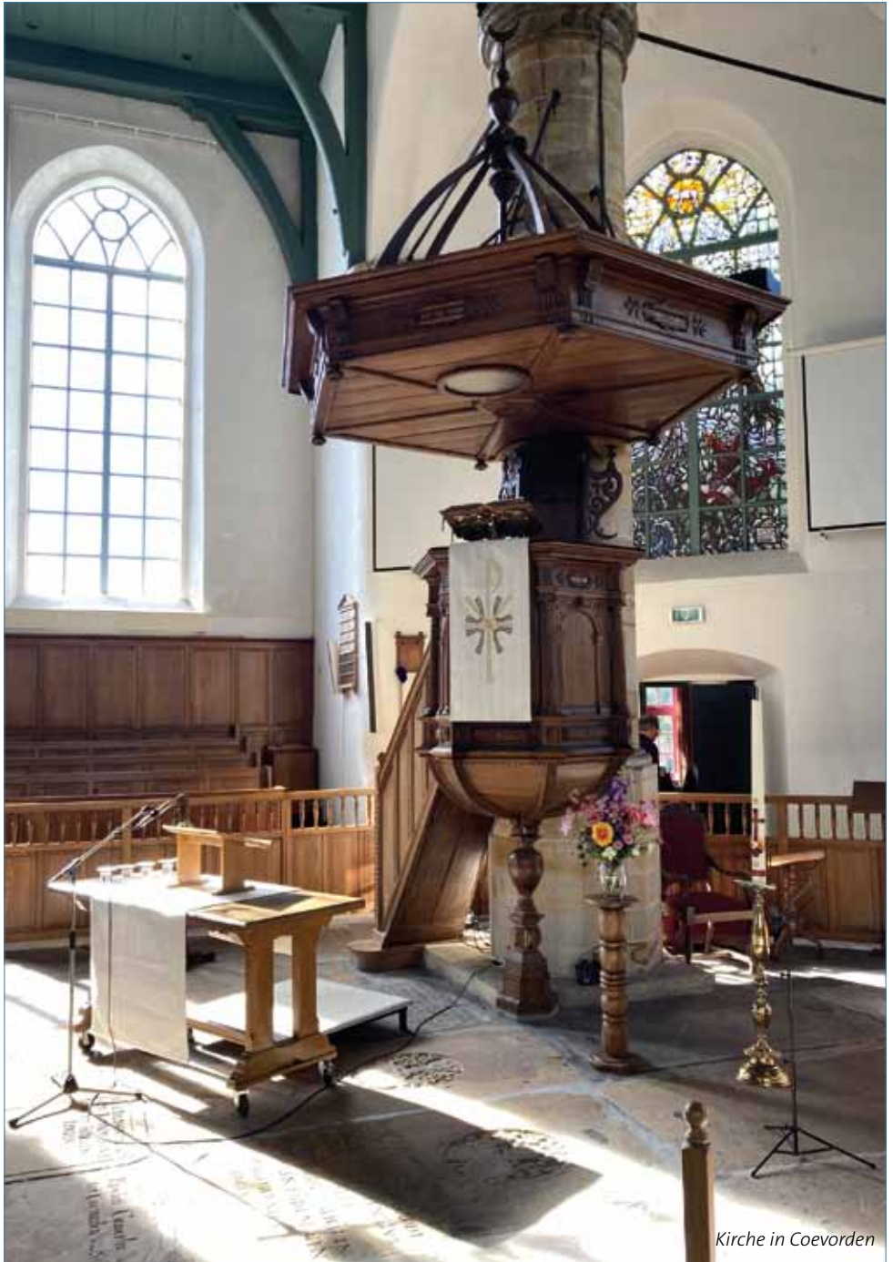
Kirche in Coevorden