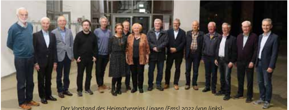
Der Vorstand des Heimatvereins Lingen (Ems) 2022 (von links):