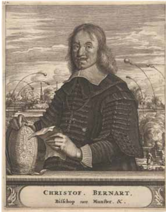
Fürstbischof Bernhard von Galen als „Bomben Bernd“